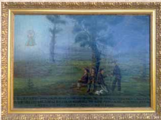
Cuadro en el que se representa a la Virgen y a 4 personas en el momento de caer sobre ellas un rayo.

Más adelante, además de las respuestas favorables a múltiples ruegos efectuados por los casliegos a lo largo